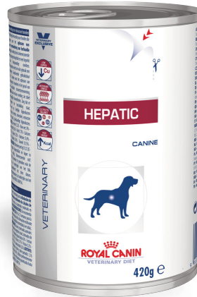
Lata de 420 g